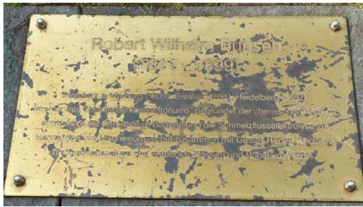
Robert Wilhelm Bunsen (1811-1899)

Professor in Marburg (1839), Breslau (1851), Heidelberg (1852).