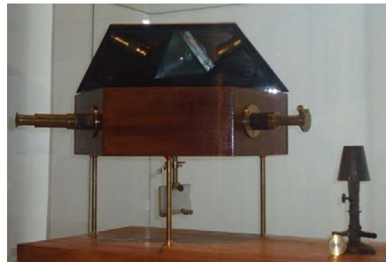
写真 3 ブンゼンが使用した分光器とバーナー

像の前にブンゼンが Kirihoff とともにスペクトル分析学の分野を開くとともに Cs, Rb を見つけ出したことなどが記された銘板が置かれていた (写真 2)。写真 1 の後